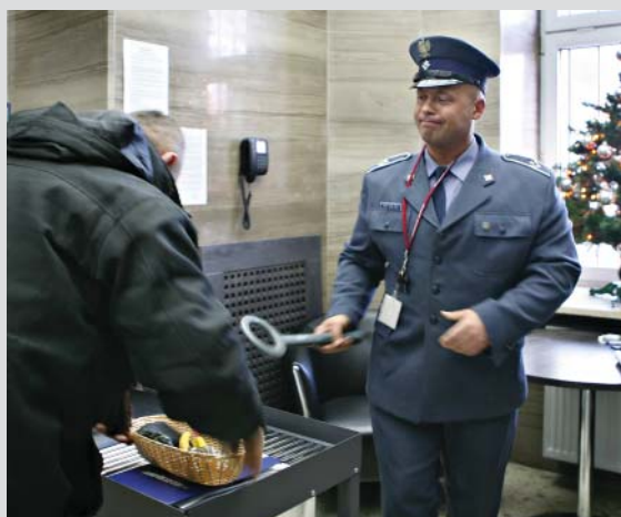
s. 16 Ta praca to wyróżnienie

OKŁADKA: Zakład Karny w Kamińsku