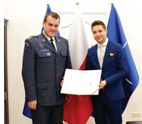
zastępcy przewodniczącego Zespołu ds. zmiany modelu naboru i szkolenia w Służbie Więziennej. red.