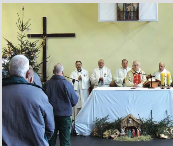
s. 22 Pasterka i opłatek