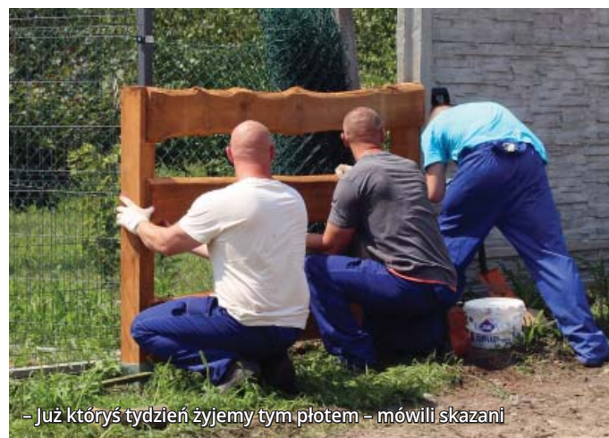
– Już któryś tydzień żyjemy tym płotem – mówili skazani

Postawa siostr, ich szacunek dla drugiego człowieka, pogoda ducha i pokora – to dobry przykład dla naszych skazanych.