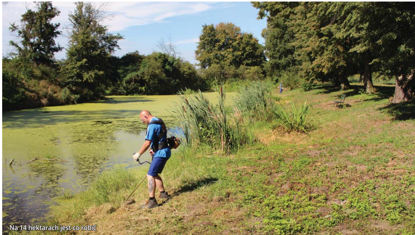
Na 14 hektarach jest co robić

Nieźmiennie odpowiadałem: „będziecie wiedzieli w sobotę”.