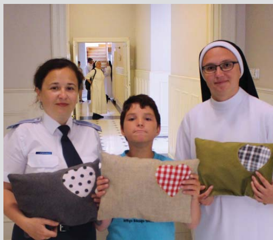
s. 28-29 Nasi w Broniszewicach