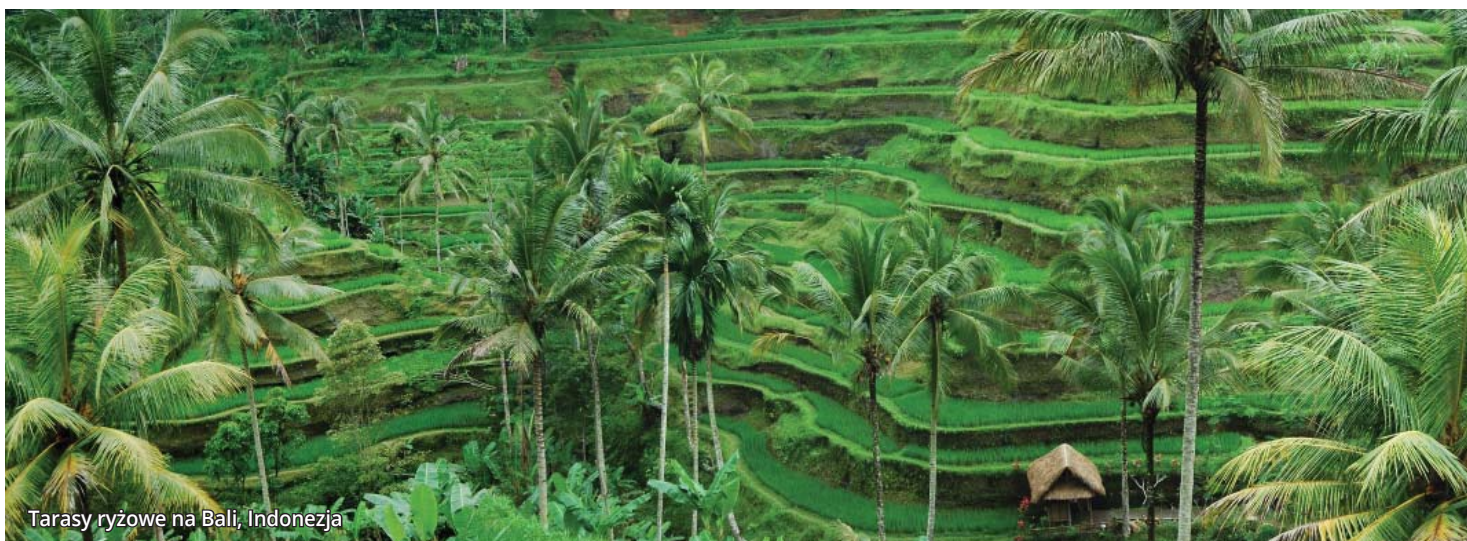
Taraszy ryżowe na Bali, Indonezja