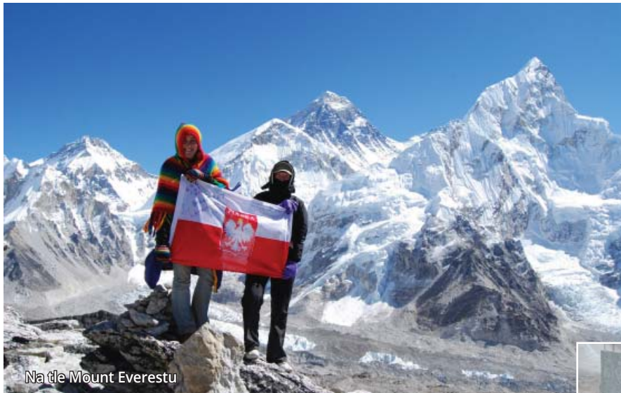
Na tle Mount Everestu