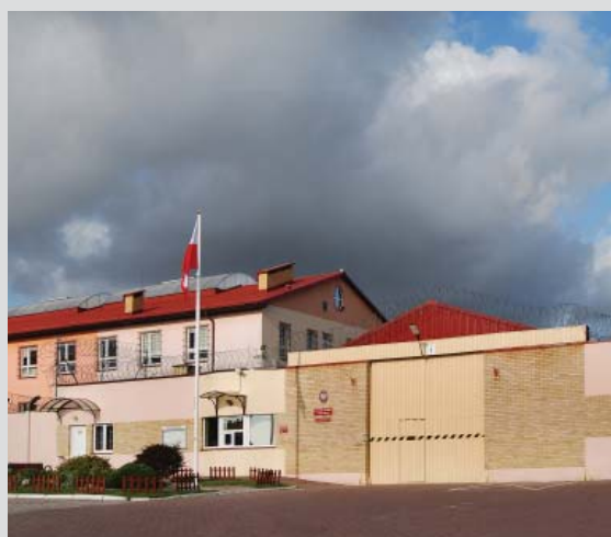
s. 24-25 Koszalin pracą stoi