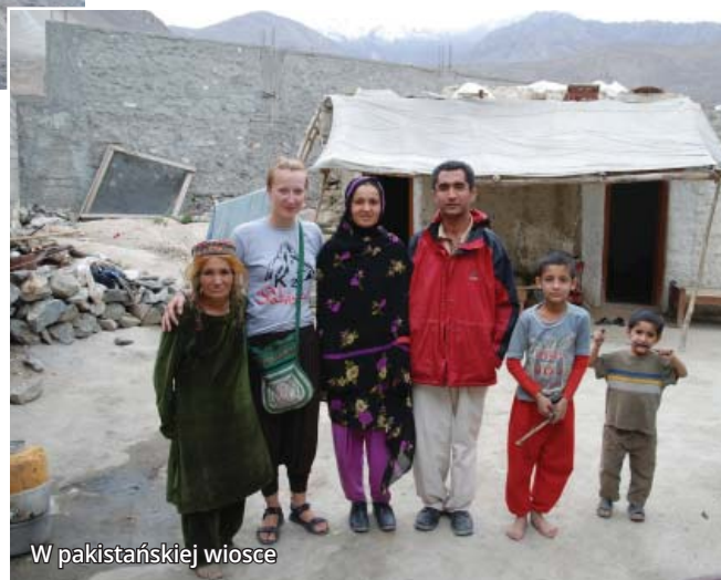
W pakistańskiej wiosce

Po Nepalu zwiedzały Indie środkowe. – Tym, co niezmiernie ułatwiło nam podróżowanie, było zdobycie wizy wielokrotnego wjazdu do Indii – podkreśla pani Do-