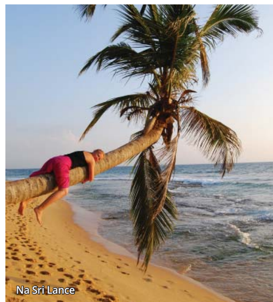
Na Sri Lance

Transsyberyjską do Hongkongu, przez całą Rosję, Syberię, Mongolię... Zobaczyć Irkuck, Bajkał, Ulan-Bator. A także wrócić w Himalaje i dotrzeć do bazy wypadowej na K2.