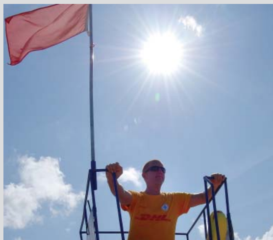
s. 20-21 Major ratownik